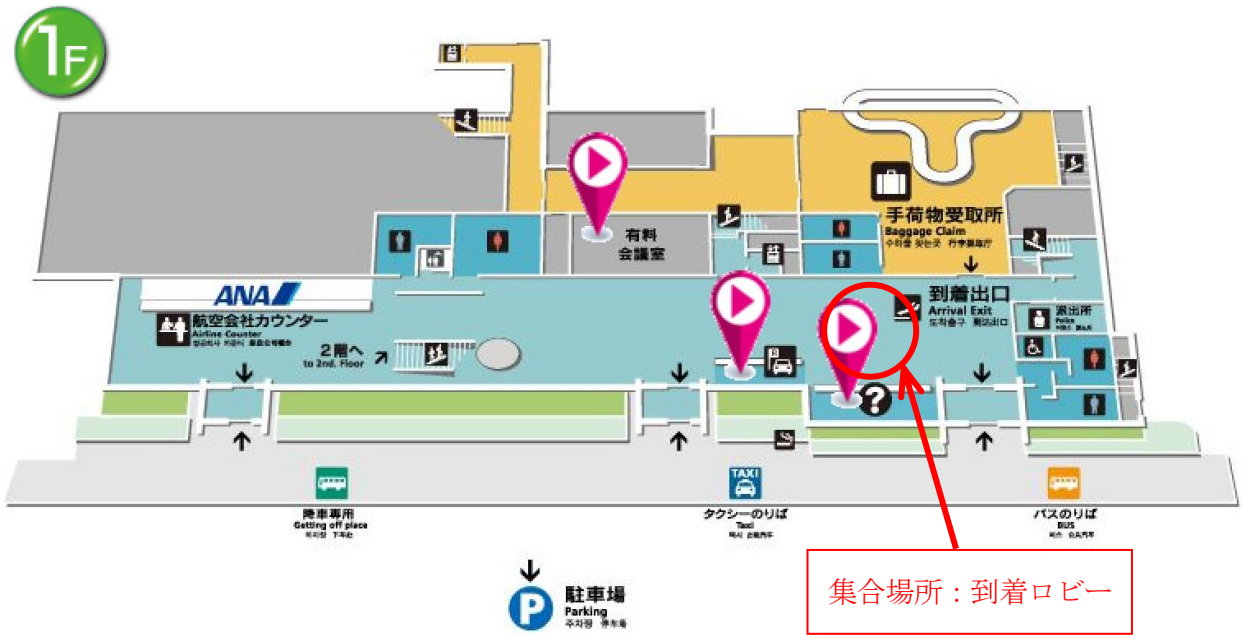
(集合場所の地図① 根室中標津空港到着ロビー)